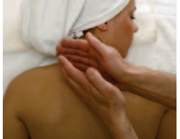
Shiatsu körperliche Beschwerden lindern und das eigene Wohlbefinden steigern