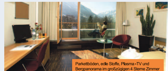
Parkettböden, edle Stoffe, Plasma-TV und Bergpanorama im großzügigen 4 Sterne Zimmer

In Einzelgesprächen und psychodynamischen Gesprächsgruppen gilt es mentale Vorbehalte aufzuarbeiten, in ausgeklügelter Kombination von körperlichen Entspannungstechniken und Naturevents wird der Stärkung des Immunsystems Rechnung getragen. Die Steigerung von Leistungs- und Konzentrationsfähigkeit steht genauso im Fokus wie ein effektives Stressmanagement und das bessere Erkennen des eigenen Risikoprofils. Clinical prevention findet in Gruppen von max. 12 Teilnehmern statt mit führenden Ärzten, Therapeuten und externen Spezialisten und kann von einzelnen Unternehmen en bloc genauso gebucht werden wie von „gemischten“ Gruppen.